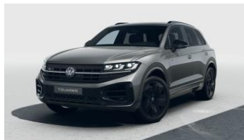
сірий металік Silicone Grey