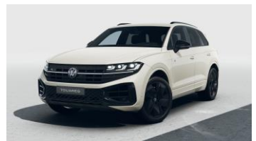
бежевий металік Sechura Beige