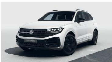
білий перламутр Oryxweiss

Вартість опційного кольору для відповідної комплектації уточнюйте у відділі продажу авто