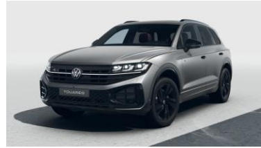
R-Line Platinum 2