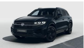
чорний металік Grenadilla Black