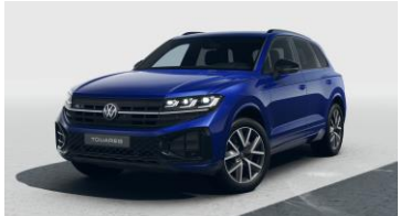
синій металік Lapiz Blue