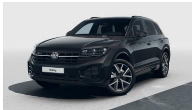
R-Line Platinum 3