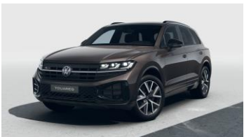
коричневий металік Tamarind Brown