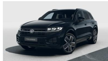
R-Line Platinum 4