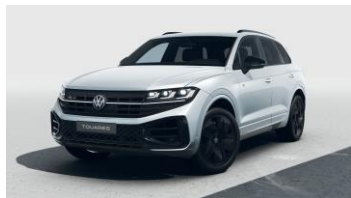
срібний металік Oyster Silver