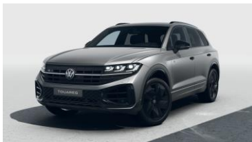
сірий мат Silicone Gray