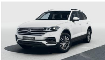
білий лак Pure White