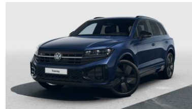
FINAL EDITION 1/2