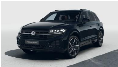
R-Line Platinum 1