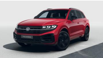
червоний металік Chili Red