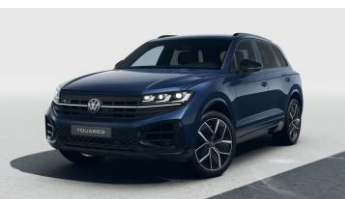
синій металік Meloe Blue Crystal Effect